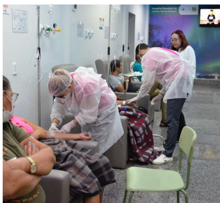
HCN foi credenciado pelo Ministério da Saúde como referência contra câncer