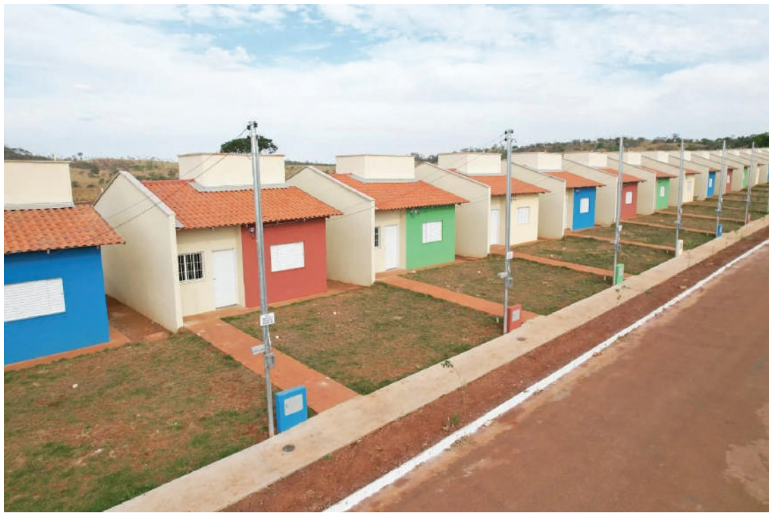
Dados revelaram que apenas 1,76% das unidades foram efetivamente destinadas às mulheres vítimas de violência doméstica

A mudança também é justificada por demanda identificada em estudos da área técnico-social da Agehab. As pesquisas