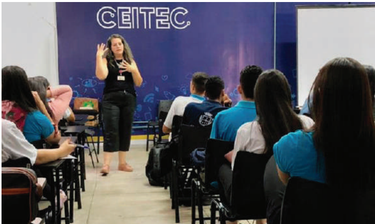
A atividade é gratuita e acontece na Sala do Empreendedor do Centro de Empreendedorismo, Inovação e Tecnologia de Anápolis

Atividade é voltada para empreendedores que desejam potencializar suas vendas a partir do bom atendimento aos consumidores