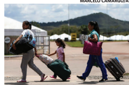
Objetivo principal é mitigar as barreiras de acesso à saúde e incluir público migrante

Criado em parceria com a Universidade Federal de Goiás (UFG), Ministério da Saúde (MS), Organização Internacional para as Migrações (OIM), da Organi-