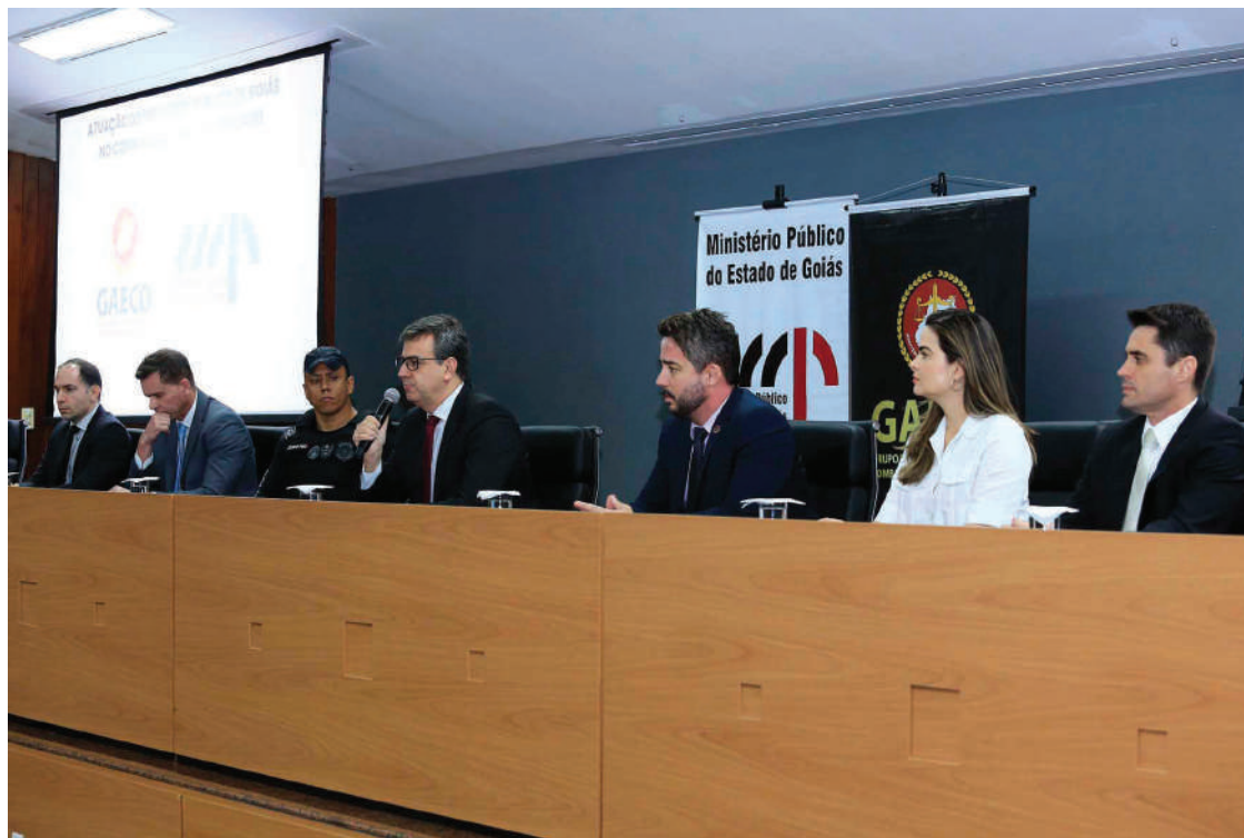
Corregedor-geral de Justiça, Cyro Terra: "é prioridade máxima do MPGO o combate ao crime organizado e às facções"

Em seguida, a Operação Família, deflagrada no dia 15 de setembro de 2023, cumpriu um mandado de busca e apreensão e dois de prisão preventiva, sendo um deles contra uma advogada. Até o momento, três pessoas foram denunciadas, sendo dois advogados. Além disso, houve a transferência de um réu para o sistema penitenciário federal (Penitenciária Federal de Mossoró).