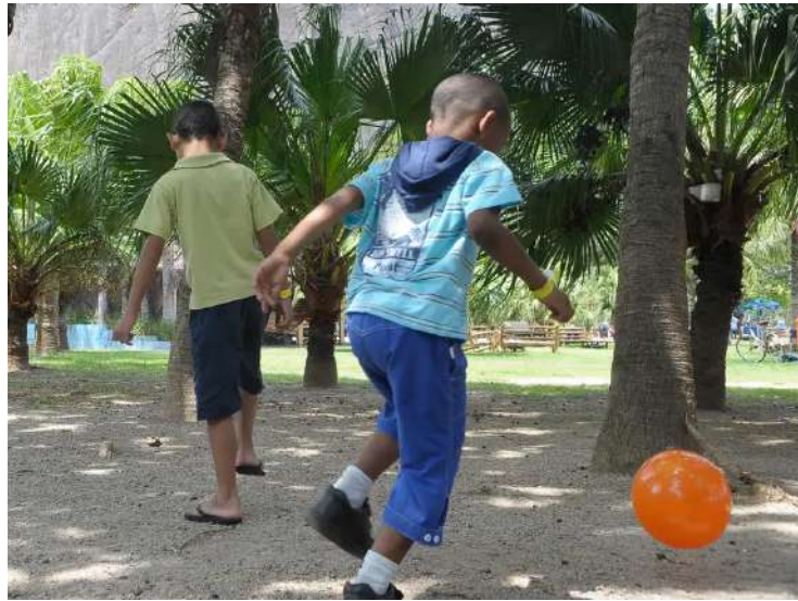
Assunto vai ser debatido no 4º Congresso Brasileiro de Urgências e Emergências Pediátricas

Para a SBP, as estatísticas demonstram a importância de manter cuidados preventivos para evitar acidentes e proteger a integridade física das crianças. A entidade avalia os dados como impactantes e destaca que grande parte desses eventos poderia ter sido evitada com medidas simples de pre-