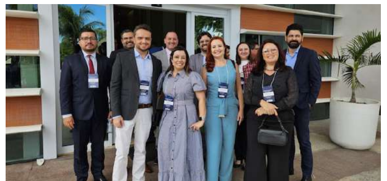
Delegação da Sead/Goiás participam de congresso