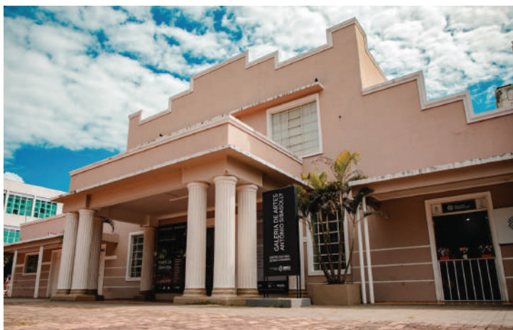
Cine Sibasolly, parceria da Território Produções Culturais e prefeitura municipal