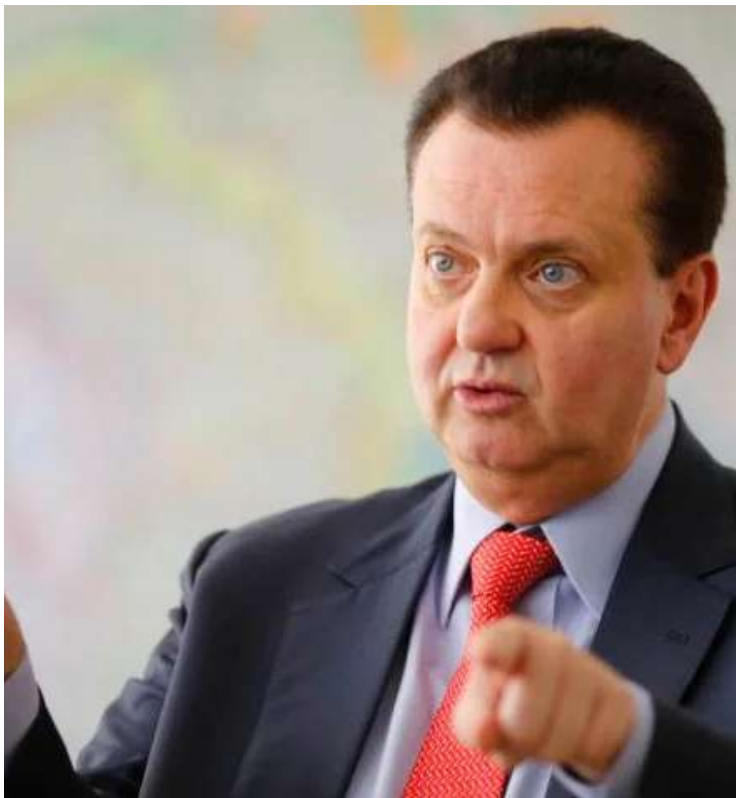
Gilberto Kassab: PSD revigorado no mapa dos prefeitos brasileiros

Mesmo perdendo o posto de partido com mais prefeitos, o MDB também cresceu: ocupa o segundo lugar, saindo de 793 prefeitos eleitos em 2020 para os atuais 916. Estados governados pelo partido como o Pará e Alagoas