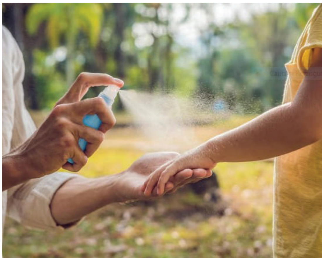
Em áreas de alta transmissão é essencial uso de repelentes, mosquiteiros com inseticida e roupas que cubram o corpo

A faculdade oferta, apenas na modalidade de aprendizagem industrial, os seguintes cursos: Operador de Processos Logísticos, Operador de Processos Industriais, Auxiliar de Laboratório Análises Físico-Química, Montador de Veículos Automotores, Mecânico Industrial, Eletricista Industrial e Assistente de Qualidade.