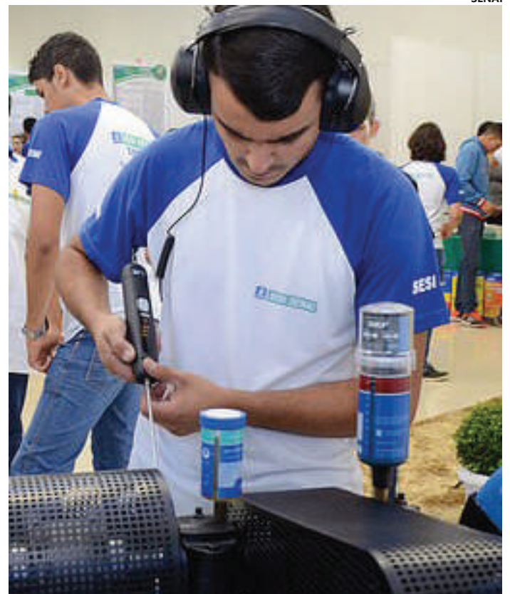
Instituição já formou e impulsionou a carreira de milhares de jovens desde sua implantação e conta com 120 empresas parceiras

Em alguns casos, o uso de medicamentos antimaláricos profiláticos pode ser recomendado, sempre sob orientação médica. A malária pode se tornar grave se não for tratada adequadamente, podendo levar à morte devido a danos cerebrais (malária cerebral) ou a órgãos vitais.