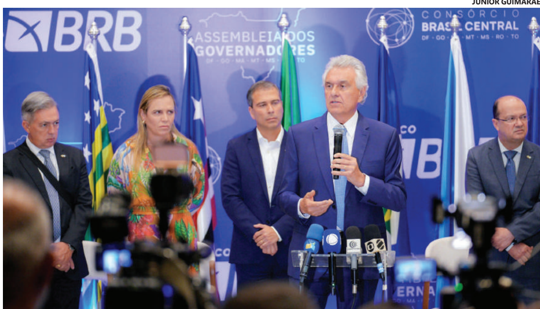
Ronaldo Caiado, durante encontro com gestores de cinco estados e do Distrito Federal, refuta “prato feito”

“Nós somos os geradores de impostos, não cabe a nós receber um prato feito da União”, defendeu Caiado em sua fala